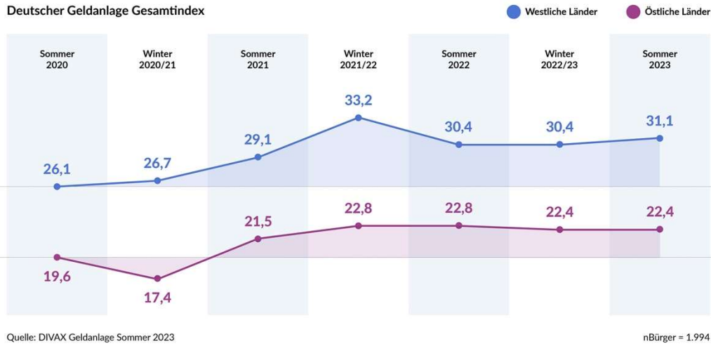
Abb. 1: Zeitliche Entwicklung des Deutschen Geldanlage-Index (DIVAX-GA) seit Auflage nach alten und neuen Bundesländern. Die jeweiligen Index-Werte berechnen sich als arithmetische Mittel der beiden Einzelindizes „Aktuelle Lage“ und „Künftige Erwartungen“. Die zugrundeliegenden Befragungen wurden von INSA-CONSULIERE im Auftrag des DIVA durchgeführt (Stand: 31.07.2023), n=1.994.

Der Geldanlage-Optimismus (DIVAX-GA) misst das Stimmungsbild der Menschen in Deutschland zum Thema Geldanlage und kann Werte zwischen 100 und -100 annehmen. Er befindet sich seit Start der Erhebung auf optimistisch hohem Niveau. Die etwas weniger hohen Werte im Osten stehen im Zusammenhang mit dem Wohlstandsniveau insgesamt. Im Osten wie im Westen hat sich das Stimmungsbild in den letzten drei Jahren verbessert.