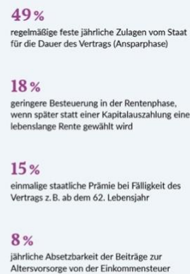
Abb. 2: Bürgerbefragungen zur Einstellung gegenüber staatlichen Vorgaben bei der privaten Altersvorsorge sowie zu bevorzugten staatlichen Fördermaßnahmen bei der privaten aktienbasierten Vorsorge. Quelle: INSA-CONSULERE im Auftrag des DIVA (Stand: 30.09.2022), n=2.011

Bevorzugte Fördermaßnahmen für eine aktienbasierte Vorsorge: